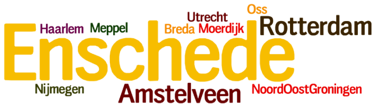
Figuur 1: Barometer Maatschappelijk Vastgoed 2012: visie en onderzoek (Veuger et al, 2012: 22)

In de Barometer Maatschappelijk Vastgoed 2012 (Veuger et al 2012) is aan gemeenten voor het eerst gevraagd naar de koplopers of goede voorbeelden op het gebied van Maatschappelijk Vastgoed. Het resultaat daarvan staat in onderstaande woordwolk. Hieruit kan worden afgelezen dat de gemeente Enschede het meest vaak wordt genoemd, gevolgd door Rotterdam en Amstelveen. De aspecten van het beleid van deze koplopers zijn vooral inspirerend vanwege de wijze van organiseren, de inhoud en de kennis.