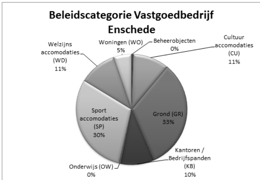
Figuur 2: Verdeling aantal objecten per vastgoedcategorie, gemeente Enschede

De vastgoedportefeuille van de gemeente Enschede is verdeeld in verschillende deelportefeuilles: Dienst Complementaire Werken (DCW), Onderwijshuisvesting, Parkeerbedrijf, Planeconomie, Vastgoedbedrijf Enschede en Volkspark. In totaal omvat de vastgoedportefeuille van de gemeente Enschede 422 panden met een totale WOZ waarde van circa 520 miljoen euro. De grootste waarden zitten in de huisvesting van het onderwijs en in de panden in beheer bij het vastgoedbedrijf. De parkeergarages vertegenwoordigen per object de grootste waarde.