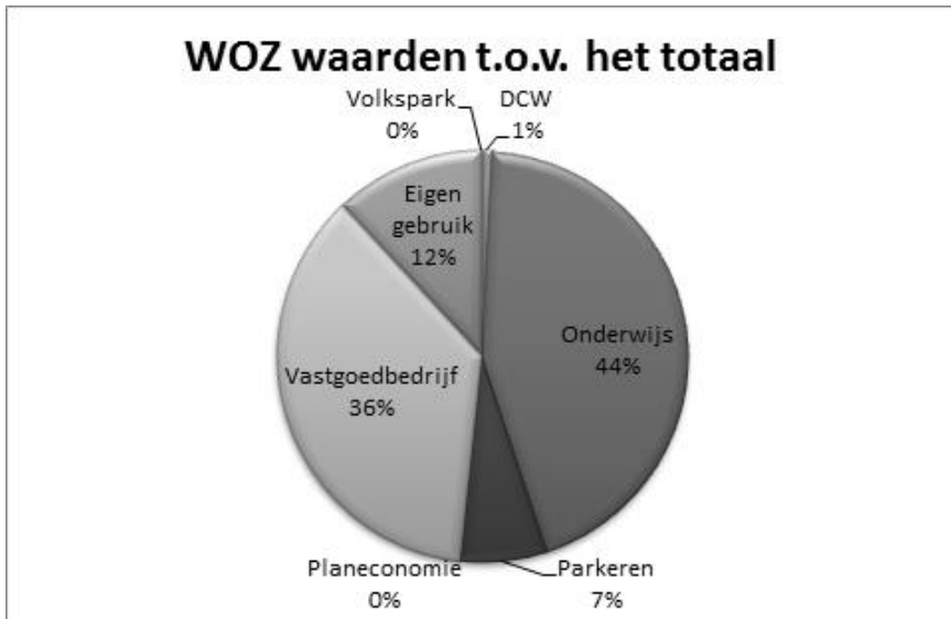
Figuur 3: WOZ-waarde per categorie vastgoed Enschede 2013

Het Vastgoedbedrijf Enschede heeft van de gemeentelijke portefeuille 225 panden met een gezamenlijke waarde van circa 230 miljoen euro onder haar beheer. In 2013 beheert planeconomie 57 panden. De 130 onderwijspanden vertegenwoordigen een waarde van circa 220 miljoen euro, waarvan de Scholingsboulevard een vijfde vertegenwoordigt. Het Volkspark heeft door de schenking in het verleden een geheel eigen aparte status.