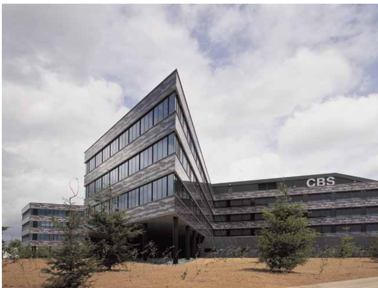
Het CBS-gebouw in Heerlen is een voorbeeld van hoe de Rgd marktverstoring probeert te voorkomen.